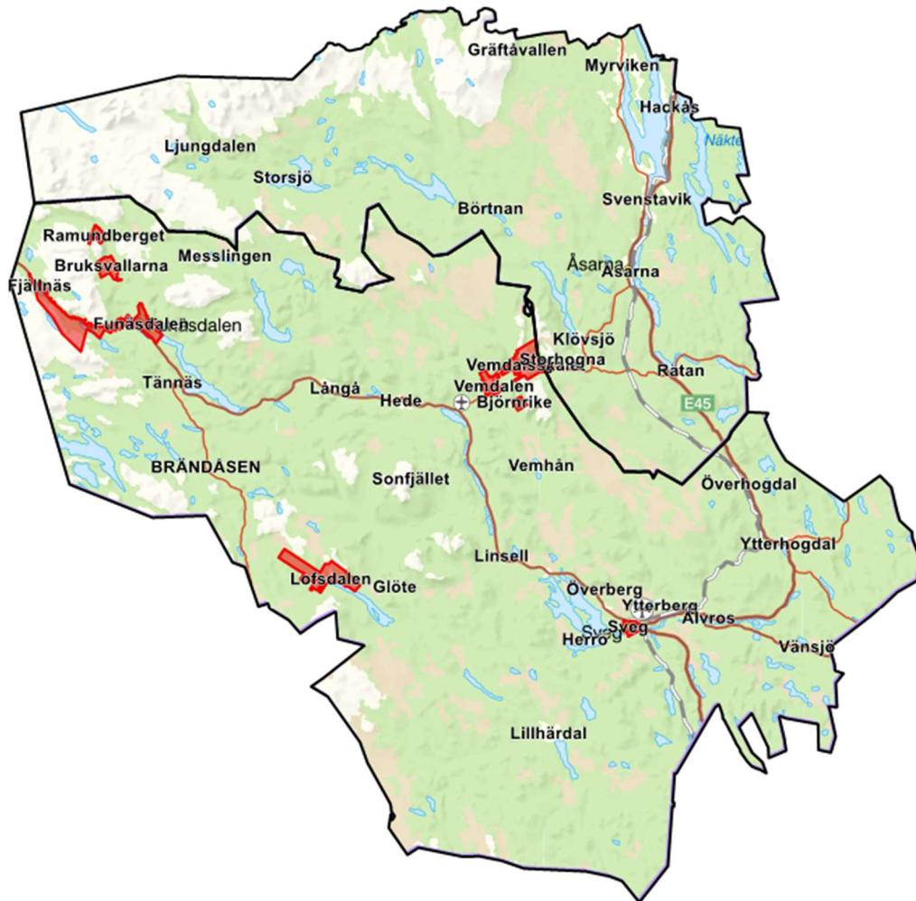
Fig. 2. Teknikområde krantömning markerat med rött.

(Lofsdalen, Sveg, Björnrike, Vemdalen, Vemdalsaskalet, Tännadalen, Fjällnäs, Ramundberget, Bruksvallarna, Funäsdalen)