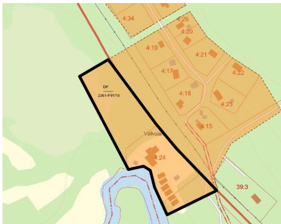
Bild 2. Översiktskarta med gällande detaljplans utbredning och aktuell upphävandeplans avgränsning markerad med svart linje